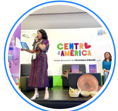
Corazón de Maíz