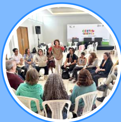
Sesión Puentes entre nosotros