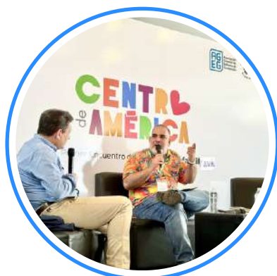
Literatura juvenil y la formación de lectores