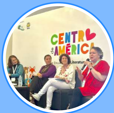
Editando literatura para la niñez. Modalidades y desafíos