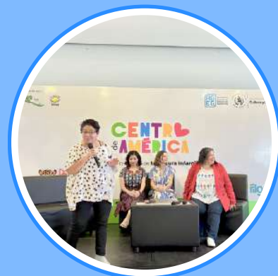
Proyectos emblemáticos en la región