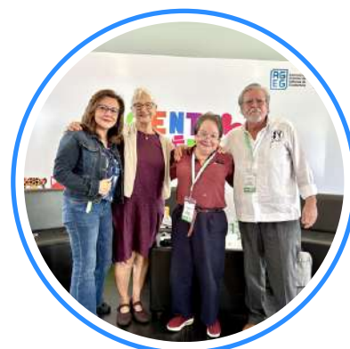
Tradición oral, identidad y tendencias del mercado