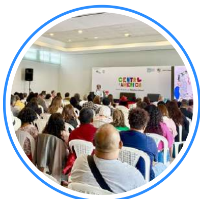
Conferencia Inaugural: Panorama y lectura crítica de la literatura infantil y juvenil en América Latina.